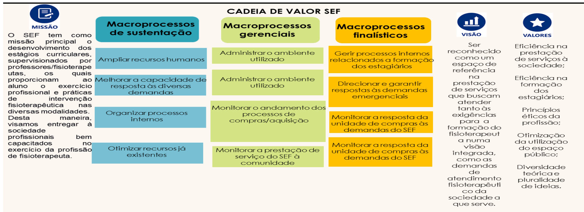
Figura 2: Valores do SEF