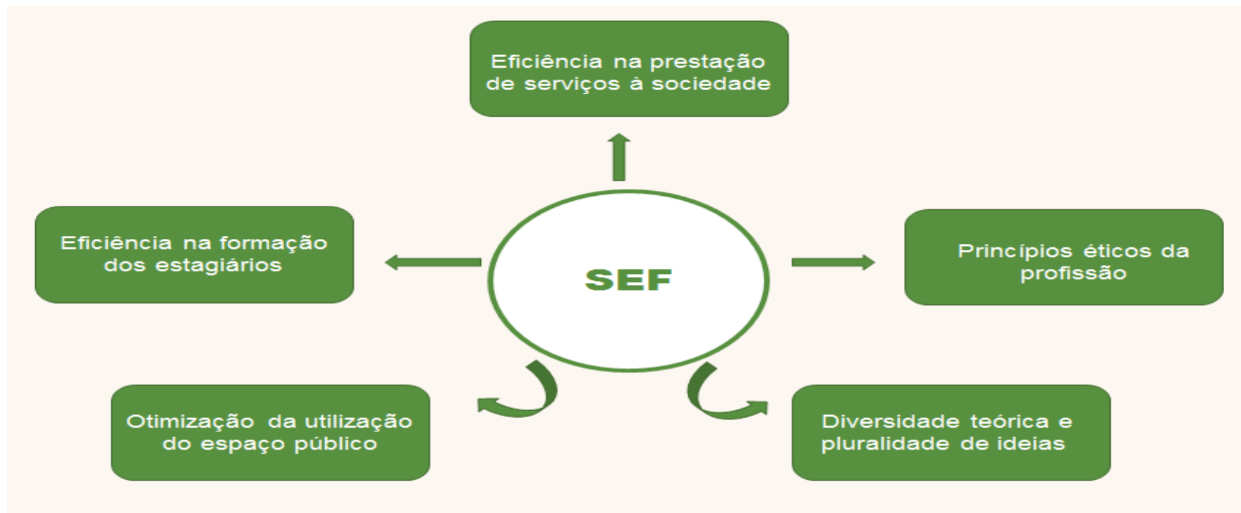
Figura 1: Valores do SEF