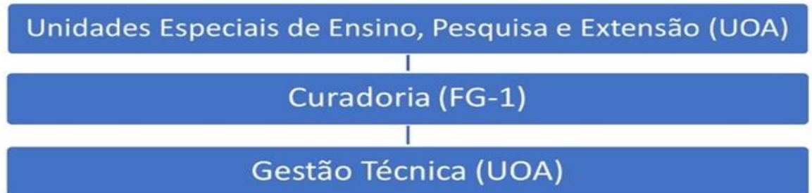
Figura 2 Organograma da Coleção Zoológica Delta do Parnaíba