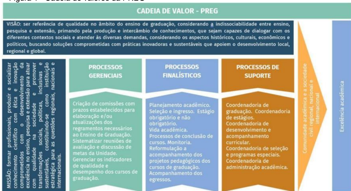
Figura 1 - Cadeia de valores da PREG