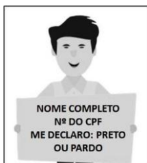
Figura 3. Modelo de Autodeclaração para o vídeo.

VII - boa iluminação; VIII - fundo branco; IX - sem maquiagem e adereços como óculos, bonés, chapéus, entre outros; X - sem filtros de edição; XI - boa resolução; e, XII - som audível.