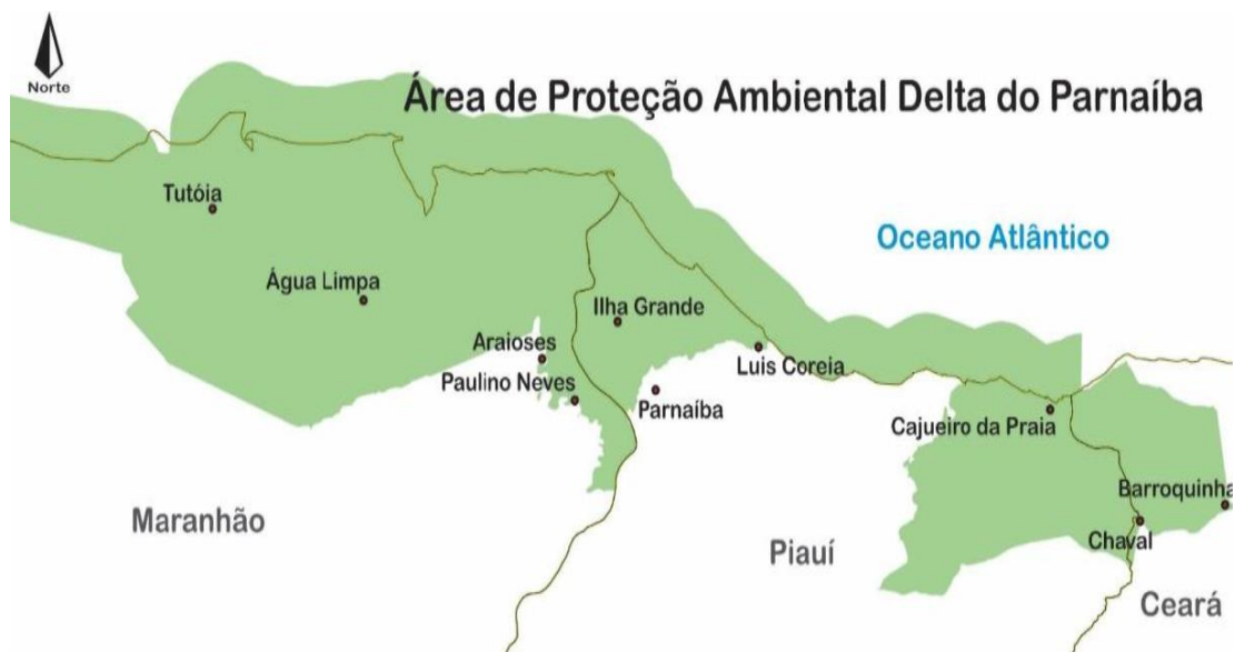
Imagem 1 - Área de Proteção Ambiental do Delta do Parnaíba