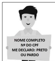
Figura 3. Modelo de Autodeclaração para o vídeo.