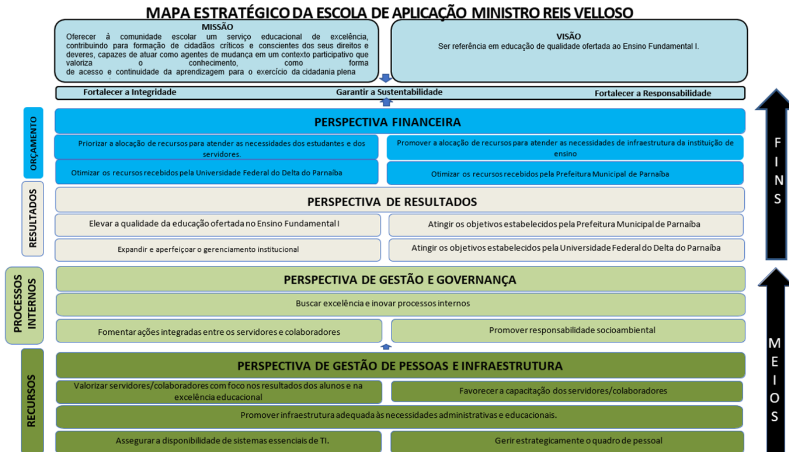
Figura 2 – Mapa Estratégico da Escola de Aplicação Ministro Reis Velloso