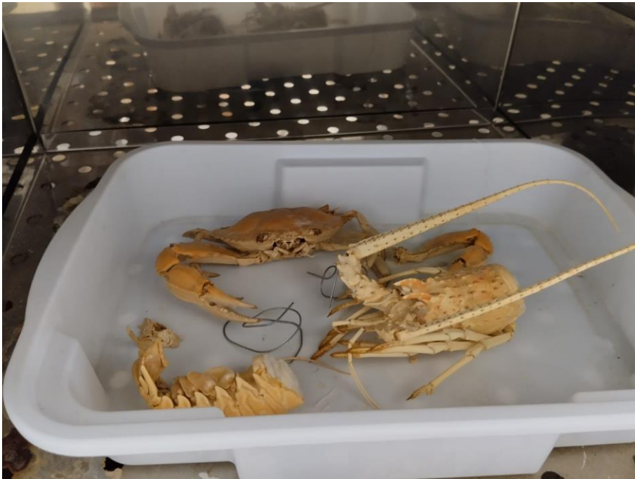
Figura 7 Preparação de material didático pela CZDP