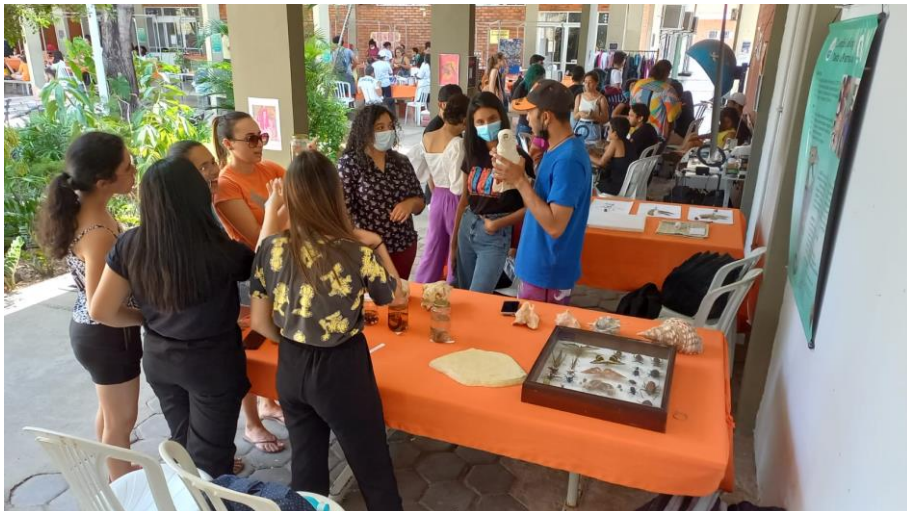
Figura 5 Exposição itinerante da CZDP durante a Feira Laços