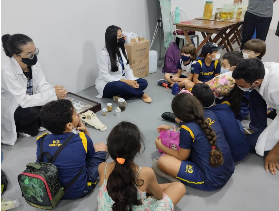
Figura 6 Exposição itinerante da CZDP no Museu do Mar