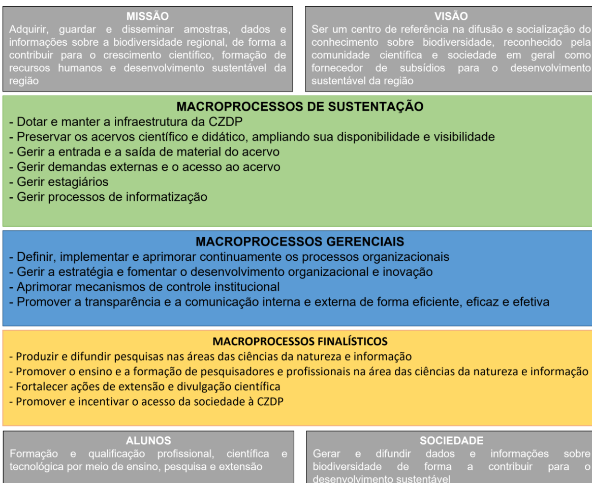
Figura 1 Cadeia de valor da Coleção Zoológica Delta do Parnaíba - UFDPar