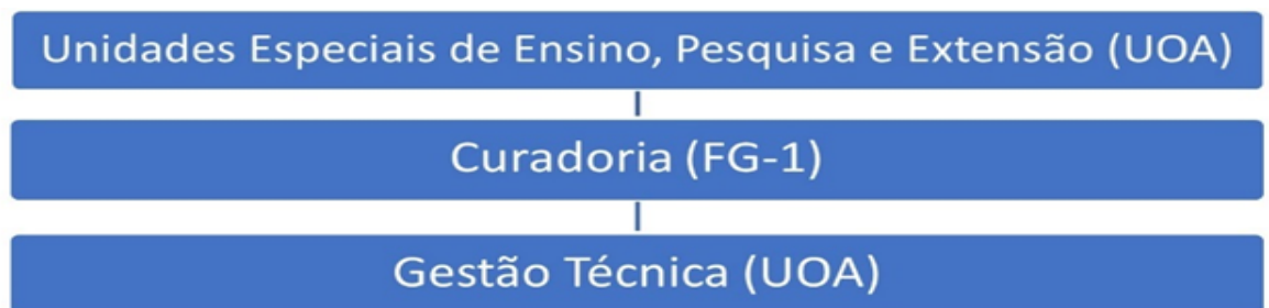
Figura 1 Organograma da Coleção Zoológica Delta do Parnaíba

A estrutura hierárquica da CZDP, inclusive seu organograma (Figura 1), se baseia em regimento desatualizado, aprovado ainda enquanto UFPI no ano de 2016. Com a criação da UFDPAr a atualização desse regimento é tarefa obrigatória, que, no entanto, ainda não pôde ser concluída.