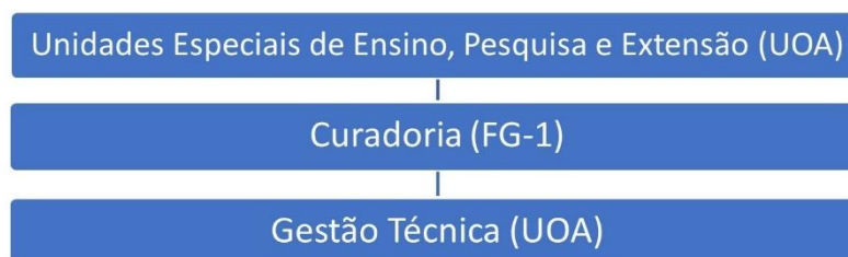
Figura 1. Organograma da Coleção Zoológica Delta do Parnaíba

A estrutura hierárquica da CZDP, inclusive seu organograma, se baseia em regimento desatualizado, aprovado ainda enquanto UFPI no ano de 2016. Com a criação da UFDPAr a atualização desse regimento é tarefa obrigatória, que, no entanto, ainda não pôde ser concluída.