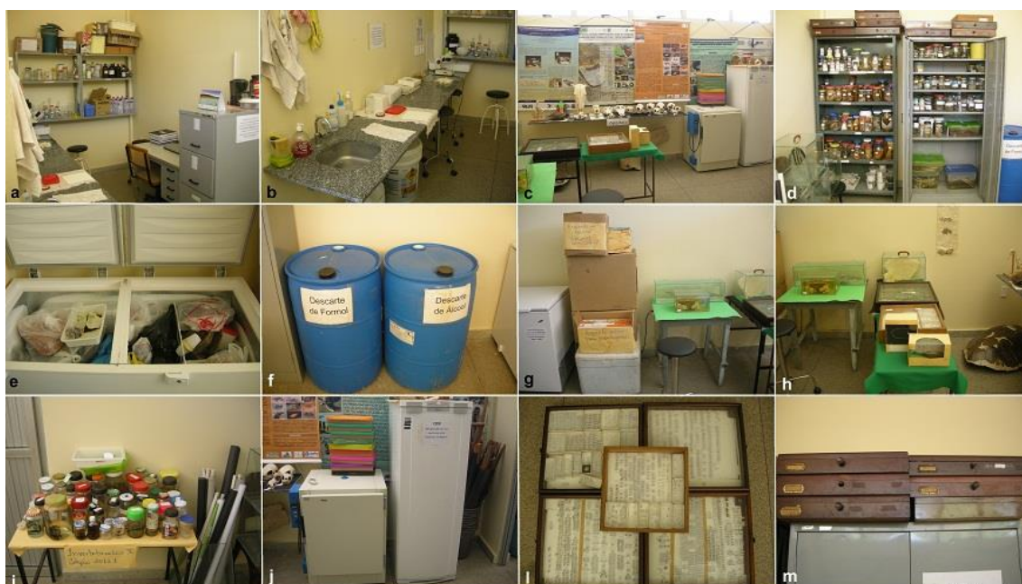
Figura 1. Coleção Zoológica Delta do Parnaíba (CZDP) em Parnaíba/PI. Legenda: (a-b) sala de preparação e tombamento; (c-m) acervo didático-científico.

A Coleção Zoológica Delta do Parnaíba (CZDP) conta com um espaço (parte da antiga garagem de veículos do CMRV) destinado a Coleção Zoológica. Este espaço conta com quatro ambientes, sendo uma sala de preparação de materiais (10 m 2 ), uma sala de reunião com uma mesa e dez cadeiras (10 m 2 ), uma sala para a coleção propriamente dita (25 m 2 ) e uma sala de exposição para visitas das escolas da região de Parnaíba/PI (25 m 2 ). A Coleção Zoológica Delta do Parnaíba (Figura 1), conta hoje com um refrigerador, uma estufa de secagem, um freezer horizontal (em regime de comodato através de parceria com uma ONG local), um notebook, armários e estantes de ferro, cadeiras, banquetas e uma mesa de escritório. Possui também uma bancada de granito (cerca de 2,5m) e uma pia. Hoje a coleção agrupa exemplares dos seguintes grupos taxonômicos: quelônios, incluindo marinhos; peixes; serpentes lagartos; anfíbios; mamíferos e invertebrados (insetos, aracnídeos, crustáceos, equinodermos, moluscos, miriápodes, etc.). O atual acervo possui aproximadamente 500 vertebrados e 2000 invertebrados, tendo aproximadamente 90% de informatização. Ainda possui alguns registros fósseis da bacia do Paraná, bem como mudas de serpentes, cascas de ovos de jacaré, ovos goros de tartarugas marinhas dentre outros.