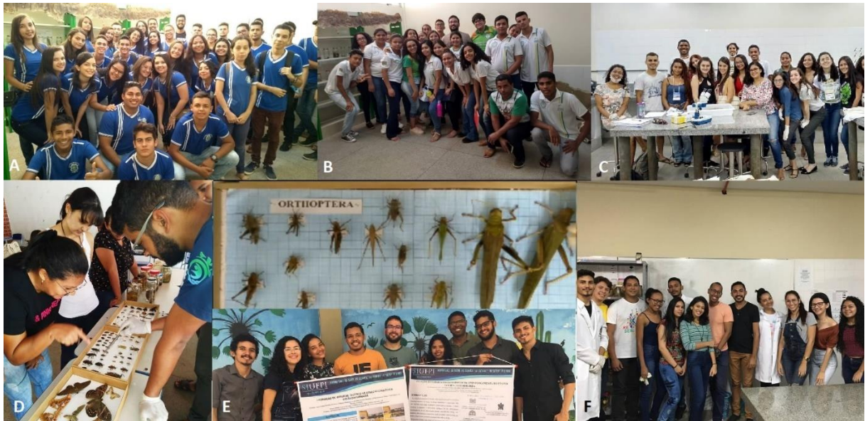
Figura 2. A. Visita de turma de alunos às instalações da CZDP; B. Visita à exposição da Coleção Zoológica Delta do Parnaíba; C. Turma de alunos da oficina de Serpentes da Caatinga ministrada pela equipe da CZDP; D. Material didático produzido durante o projeto “A Coleção Zoológica Delta do Parnaíba como espaço de educação” sendo utilizado em atividade de ensino; E. Equipe do projeto “A Coleção Zoológica Delta do Parnaíba como espaço de educação” e os dois pôsteres apresentados durante o SIUFPI; F. Oficina de identificação de serpentes, ministrada durante o SIUFPI no Campus Ministro Reis Velloso – UFPI.

Ao longo do primeiro ano do projeto a Coleção recebeu 655 visitantes oriundos de 17 municípios dos estados do Piauí, Ceará e Maranhão. Ao todo 13 instituições de ensino organizaram visitas ao acervo, abrangendo os níveis fundamental, médio e superior, e as redes pública e particular (Figura 2).