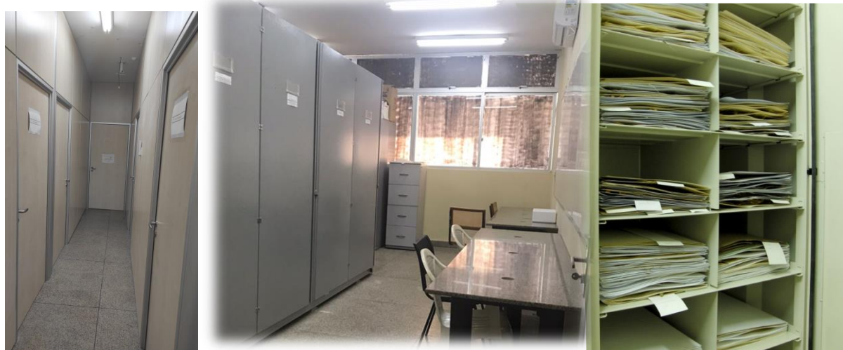
Figura 1: Coleção científica Delta do Parnaíba ()

No herbário há materiais permanentes (mobiliário, equipamentos e instrumentos) que estão relacionados no controle patrimonial da UFDPAr e material de consumo cedidos pela Instituição e algumas vezes por doação de empresas.