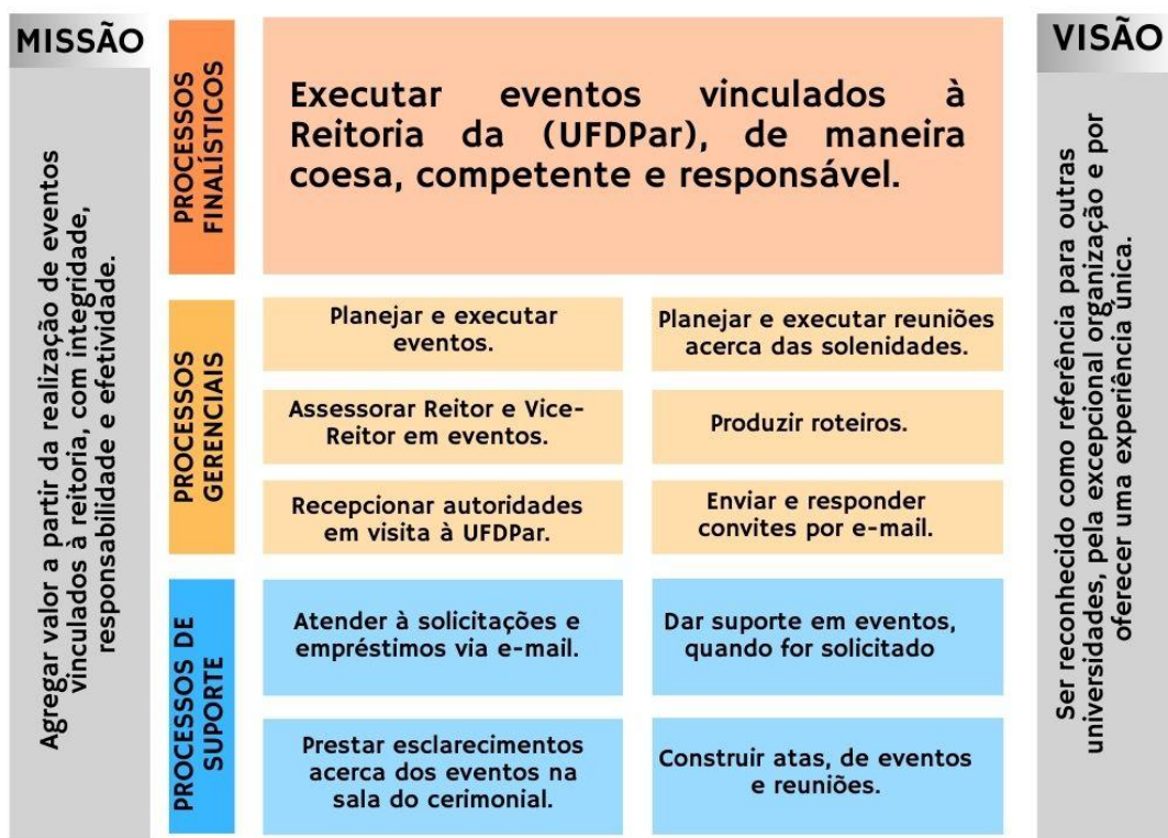
Figura 3 - Apresenta a cadeia de valores do CERIMONIAL.