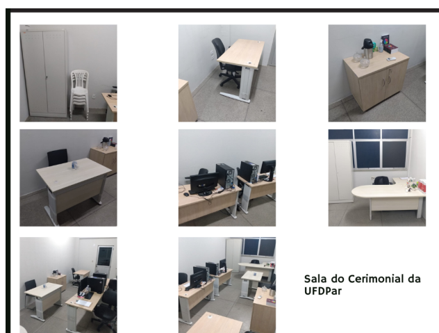
Figura 2 - Apresenta as fotos da Sala onde está inserido o CERIMONIAL.