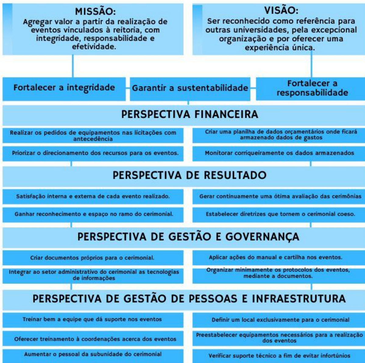
Figura 4 – Mapa estratégico do CERIMONIAL