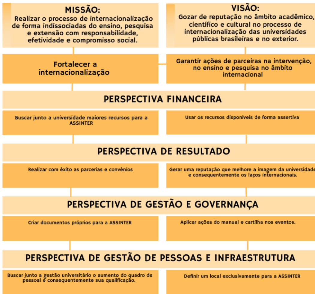
Figura 4 – Mapa estratégico da ASSINTER