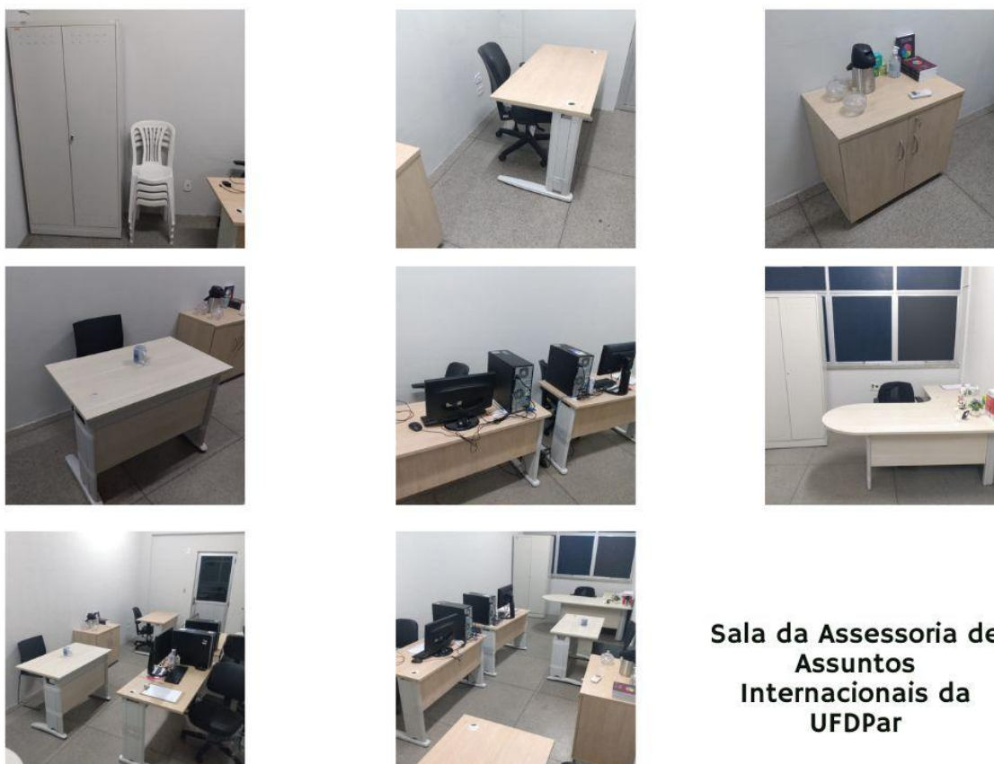
Figura 2 - Apresenta as fotos da Sala onde está inserido a ASSESSORIA PARA ASSUNTOS INTERNACIONAIS.