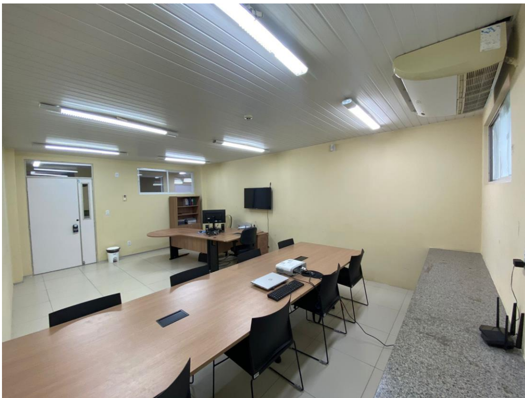
Figura 2. Sala da Unidade Setorial de Correição – USC.