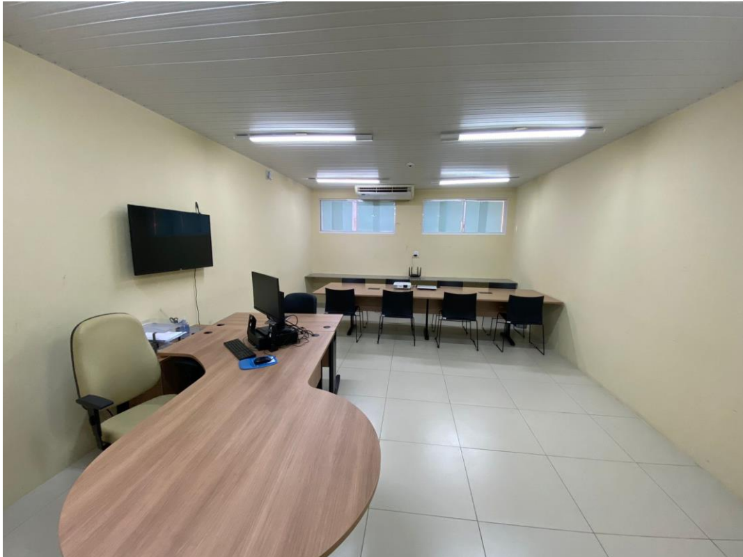
Figura 3. Sala da Unidade Setorial de Correição – USC.

A Sala da Unidade Setorial de Correição da UFDPAr, situada no Setor Norte | Bloco C - ECS - Espaço de Ciência da Saúde, Piso 2 - Lado Oeste, dispõe de: 01 (um) armário médio, 01 (uma) estação de trabalho, 01 (uma) poltrona giratória presidente, 01 (uma) poltrona giratória, 01 (uma) mesa de reunião retangular 3,5 m, 08 (oito) cadeiras fixas em polipropileno, 01 (um) computador, 01 (um) notebook, 02 (dois) estabilizadores, 01 (um) nobreak, 01 (uma) webcam, 01 (um) projetor multimídia, 01 (um) monitor 42 polegadas, 02 (dois) gaveteiros com 4 gavetas, 01 (uma) mesa retangular 1,20 m.