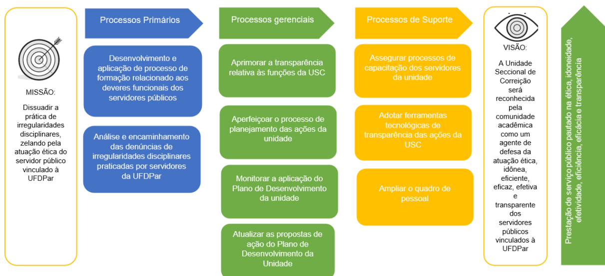
Figura 4 – Cadeia de Valores da Unidade Setorial de Correição – USC.