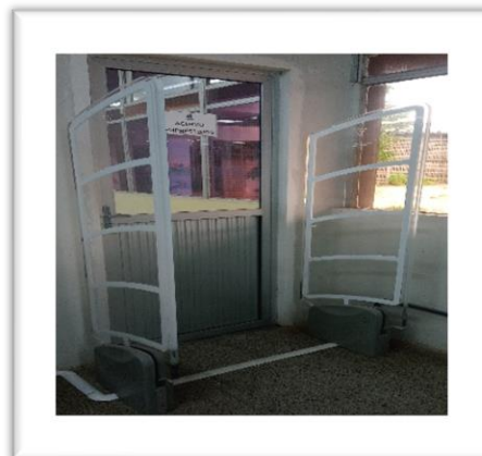
Figura 2: Portão Eletromagnético