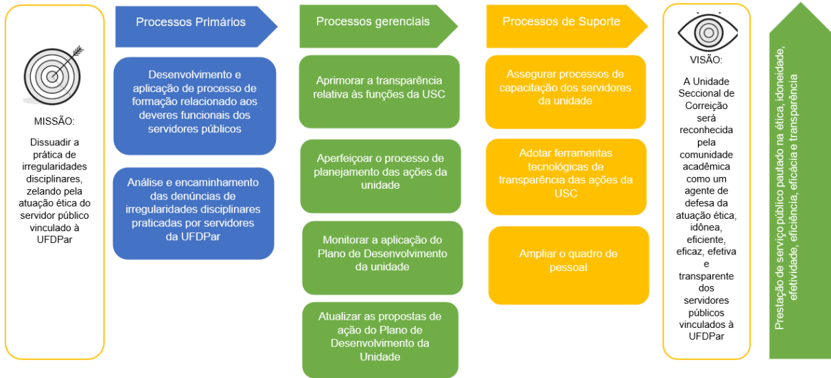
Figura 3 – Cadeia de Valores da Unidade Setorial de Correição – USC.