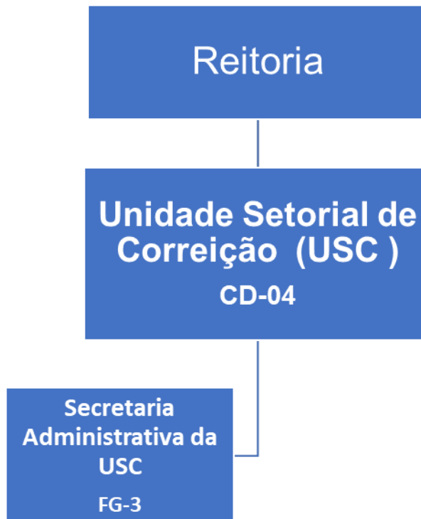
Figura 1. Organograma da Unidade Setorial de Correição-USC/UFDPAr.