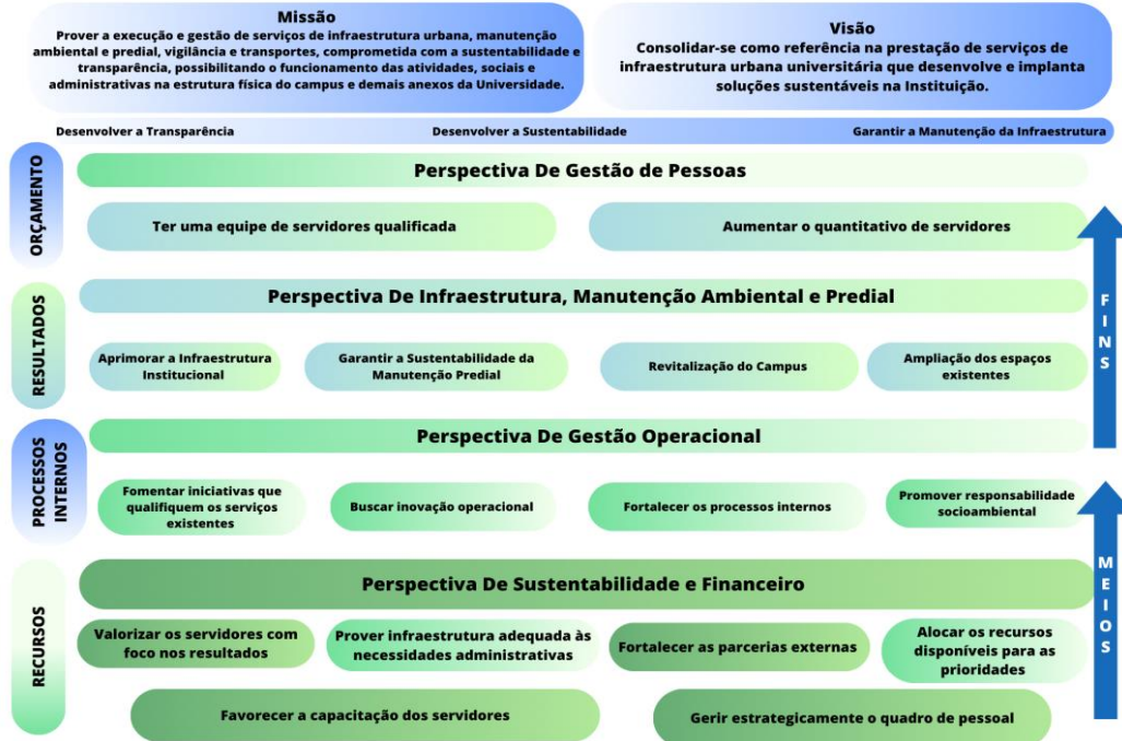
Figura 2 - Mapa Estratégico: PREUNI