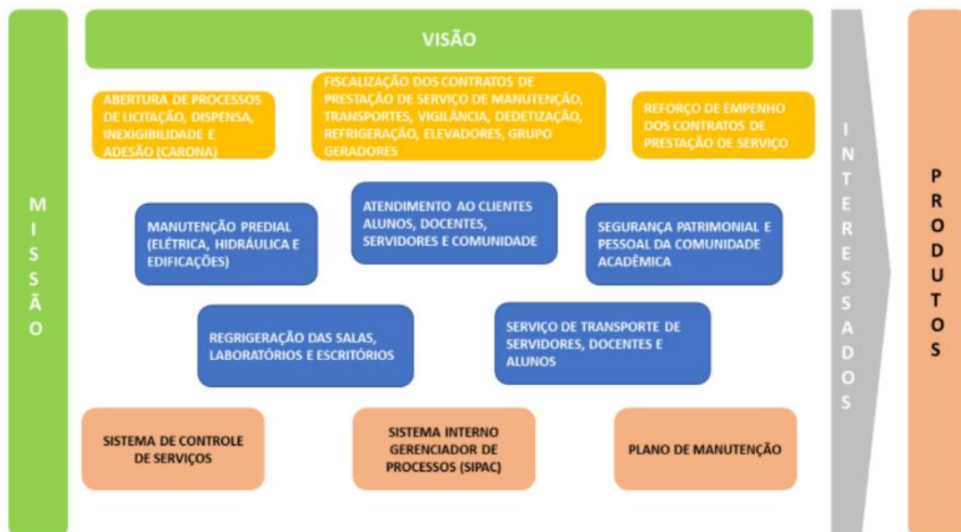
Figura 3 - Cadeia de Valores: PREUNI