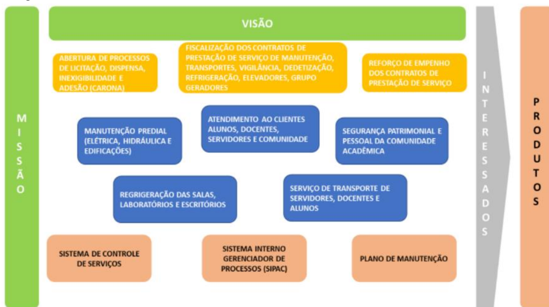
Figura 3 - Cadeia de Valores: PREUNI