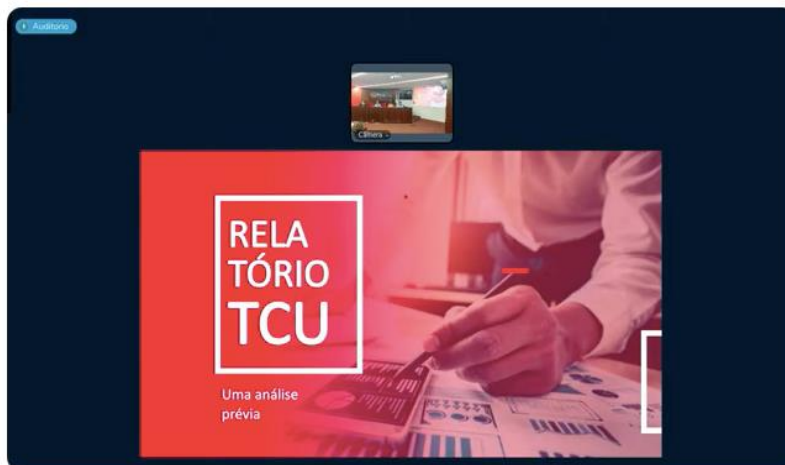
1º Encontro Nacional do Fórum Nacional de Próreitores(as) de Assuntos Estudantis (FONAPRACE)