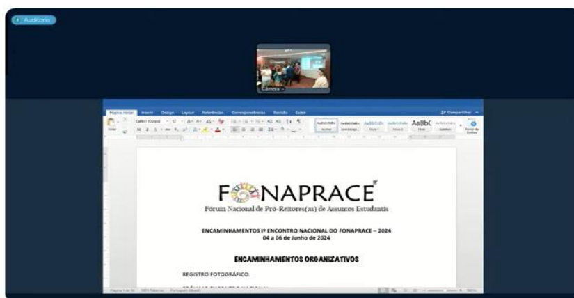
1º Encontro Nacional do Fórum Nacional de Pró-reitores(as) de Assuntos Estudantis (FONAPRACE)