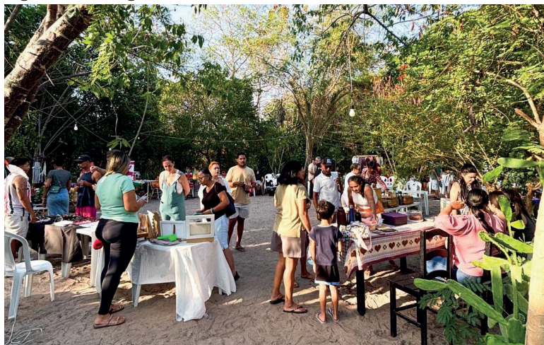
Figura 1: Vista geral da Feira no Sítio durante as atividades de circulação de visitantes.