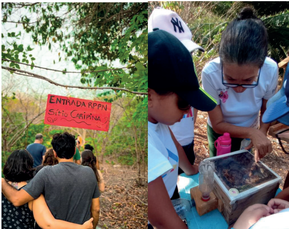
Figura 5 e 6: Trilha interpretativa na Caatinga e visita ao meliponário realizados na RPPN.