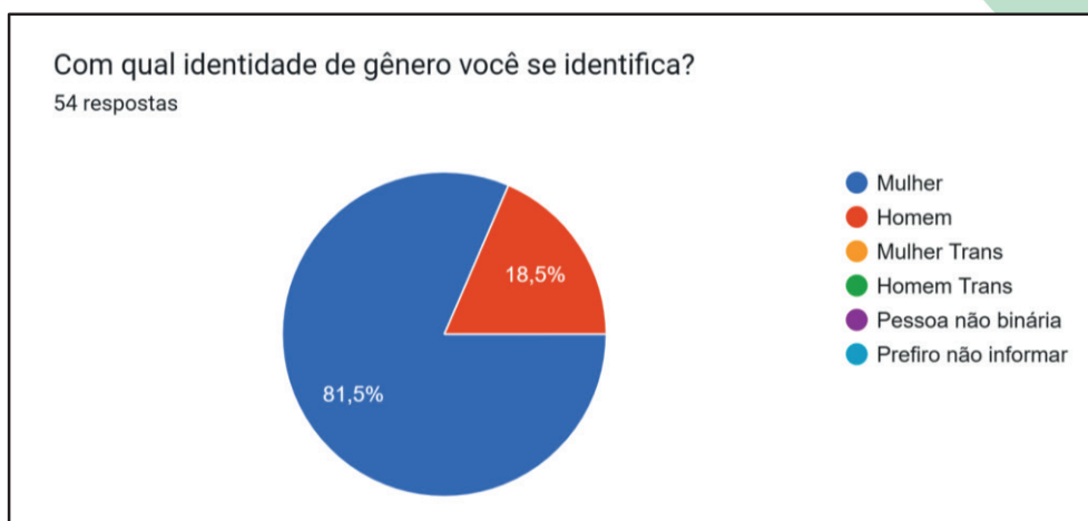
Figura 2: Identidade de gênero dos expositores

Os dados demográficos e socioprodutivos revelam predominância feminina entre os expositores, representando 81,5% do total. Esse indicativo reforça o papel central das mulheres na condução de práticas produtivas rurais e na manutenção de saberes tradicionais, em consonância com Gohn (2014), que aponta a presença feminina como eixo estruturante de iniciativas comunitárias.