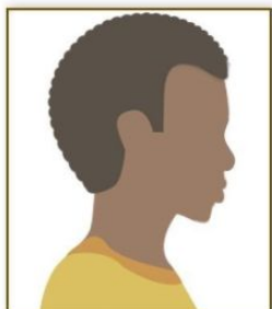
Figura 1. Modelo de Foto de Perfil